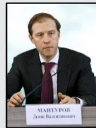
Председатель Совета Директоров Мантуров Денис Валентинович